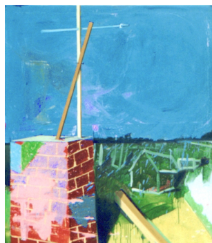
Matthias Weischer, geb. 1973, »Sockel«, 2000, Öl auf Leinwand, 140 x 120 cm

1990 bis heute zusammen. Sie hat entscheidend zur kunsthistorischen Beachtung der »Leipziger Schule« mit beigetragen.