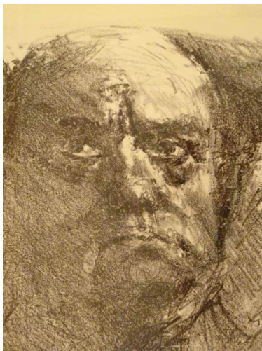
Bernhard Heisig, "für Max Beckmann", 1983, Lithografie (Ausschnitt), Kunstsammlung Leipziger Hof