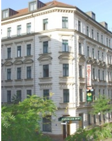
Galerie Hotel Leipziger Hof