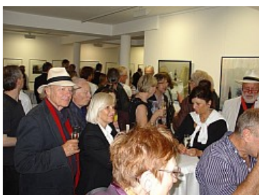
Regel Gedankenaustausch nach

Impressionen von der Ausstellungseröffnung - Video (4'06 min), (c) galerie.leipziger-schule, 2011