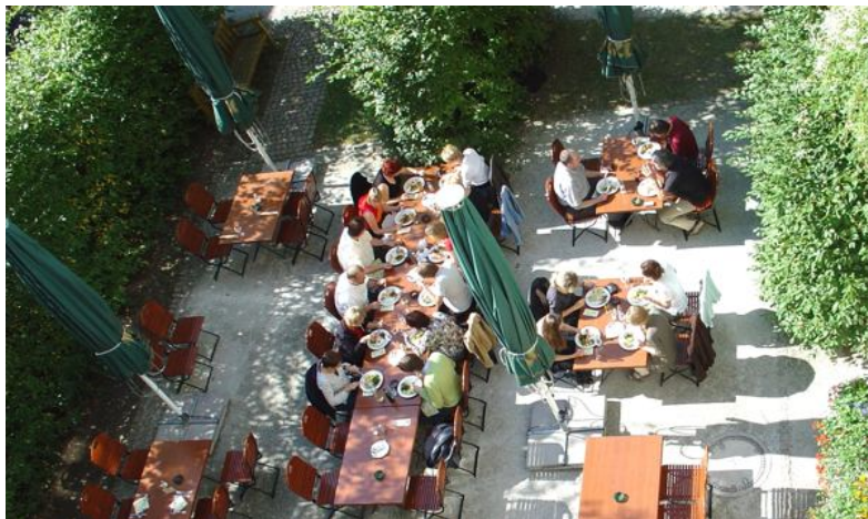
Ein gemütlicher Mittagstisch im Grünen.