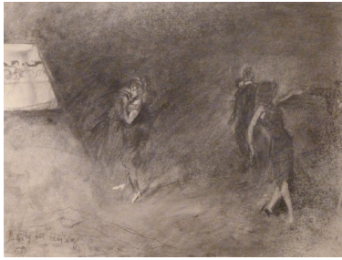
Hanns Mayer-Foreyt, "Party bei Heisig", 1959, Kohlezeichnung, Kunstsammlung Leipziger Hof